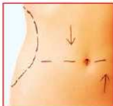
▲ Beim Fettsaugen am Bauch werden kleine Schnitte gemacht

39 | Wie kriege ich einen flachen Bauch? Wenn es um einen reinen Fettüberschuss geht, wird bei der OP das Unterhautfettgewebe am Ober- und Unterbauch abgesaugt. Je nach Ausmaß dauert der Eingriff 1-3 Stunden. Handelt es sich um eine sogenannte Fettschürze, weil das Gewebe keine Spannung mehr hat, wird eine Bauchstraffung gemacht. Dabei wird überschüssige Haut und Gewebe entfernt, die überdehnten Muskeln werden gestrafft.