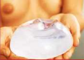
Implantate (aus Silikon) gelten in der Regel als sicher - trotzdem bleibt ein Risiko

32 | Kann ich mit Implantaten noch stillen - und auch zur Mammografie gehen? Beides ist kein Problem. Das Drüsengewebe, das für das Stillen wichtig ist, bleibt erhalten. Bei der Mammografie ist es nur wichtig, vorher den Radiologen zu informieren.