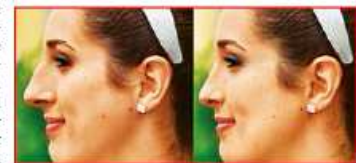
▲ Manche stört so ein kleiner Nasenhöcker