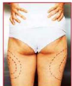
▲ Straffe Oberschenkel auch ohne OP: Needling heißt die Therapie

45 | Bekomme ich Cellulite ohne OP weg? Die Behandlung von Cellulite ist nicht einfach. Durch ein sogenanntes Needling kann eine Besserung erzielt werden. Die Behandlung mit einem speziellen Nadelroller regt die Kollagenbildung an, strafft das Bindegewebe. Zudem kann mit der Fettwegspritze ein Straffungseffekt erzielt werden.