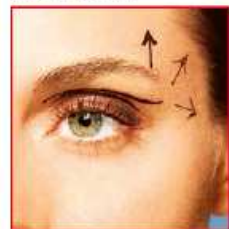
▲ Bei der Lidkorrektur wird Gewebe in der Lidumschlagsfalte entfernt

Man kann sie durch eine Oberlidstraffung behandeln. Und dabei auch Fett, das häufig im Augenwinkel sichtbar ist, mit entfernen. Das ist in der Regel ein absolut komplikationsarmer Eingriff, der unter örtlicher Betäubung möglich ist.