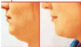
▲ Das Entfernen von Fettgewebe am Hals hilft gegen ein Doppelkinn

27 | Wie werde ich mein Doppelkinn los? Das Fettgewebe wird dabei am Hals entweder durch Absaugen oder über einen kleinen Schnitt offen entfernt. Die Haut liegt wieder am Hals, so wird die Halskontur automatisch betont. Die Halsmuskeln, die im Alter ja etwas