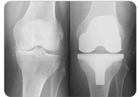
Kniegelenksarthrose mit Verlust des Gelenkknorpels. Ersatz durch Total-Endoprothese mit sofortiger Belastbarkeit.

Bei schwerer Knie- bzw. Hüftgelenkarthrose mit stark eingeschränkter Gehfähigkeit wird durch eine Endoprothese die Gelenkfunktion wieder hergestellt und rasch eine schmerzfreie Belastbarkeit und hohe Lebensqualität erreicht.