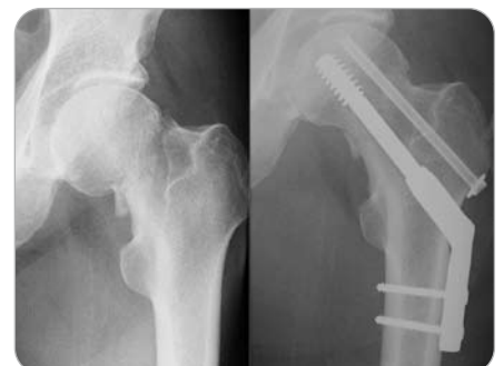
Schenkelhalsfraktur. Versorgung durch Osteosynthese (Knochenverschraubung).

Durch moderne Osteosyntheseverfahren (operative Stabilisierung von Frakturen) wie z.B. Nagelung bzw. Verschraubung oder Versorgung durch Endoprothesen wird selbst bei alten und schwerkranken Patienten bei hüftgelenksnahen Oberschenkelbrüchen eine rasche Mobilisation und Wiedererlangung der Gehfähigkeit möglich.