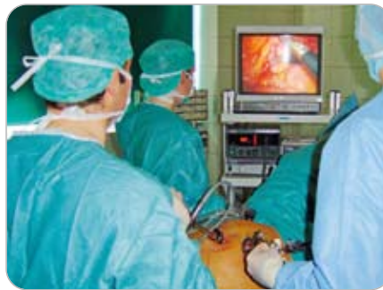
Minimal invasive Chirurgie

Alle modernen Behandlungsverfahren einschließlich minimal invasiver Chirurgie werden durchgeführt. Dabei zeigen sich besonders die über einen kleinen Hautschnitt ausgeführte offene Netztechnik sowie die endoskopische TEP-Technik anderen Verfahren bezüglich Rückfallrate und Komplikationsrate überlegen und werden deshalb von uns bevorzugt.