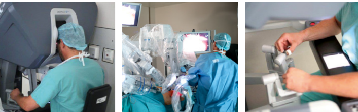
da Vinci®-Operationssystem im Einsatz

Die Klinik für Urologie am Caritas-Krankenhaus St. Josef gehört zu den größten Zentren in Deutschland für roboter-gestützte Operationen. In den letzten drei Jahren wurden über 1000 Eingriffe von zwei Operateuren vorgenommen. Dementsprechend verfügt die Regensburger Klinik über eine äußerst hohe Erfahrung und Expertise. Über kleine Schnitte am Bauch des Patienten werden Kamera und miniaturisierte Instrumente eingeführt. Der Operateur an der Konsole sieht das Operationsfeld dreidimensional und mehrfach vergrößert auf einem Bildschirm.