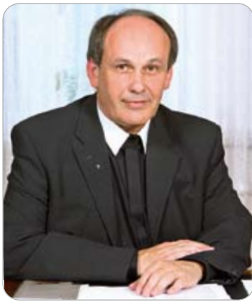
Бернгард Пиндл Капитуляр кафедрального собора Директор Епископата-Каритаса